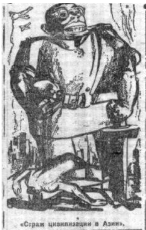
Илл. 7. «Страж цивилизации Азии»

В публикации газеты за 16 февраля 1932 г. в заметке под названием «Японские интервенты “на – страже цивилизации”» изображена карикатура «Страж цивилизации Азии» (илл. 7), которая представлена образом японца с огромной улыбкой, стоящего на трупах людей на фоне бомбардировок мирных городов. В заметке указывается, что японские бомбардировки нанесли значительный урон мирному населению и городам: так, в ходе военных операций был разрушен германский университет в Усуне с ценным оборудованием, а в «разрушенных квартирах многих германских крупных профессоров погибли ценнейшие рукописи и библиотеки» 14 .