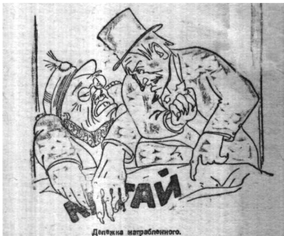
Илл. 3. «Делёжка награбленного»

Другая статья газеты за 21 октября 1931 г. под заголовком «Японо-китайский конфликт перерастает в японо-американский» сопровождается карикатурой с подписью «Делёжка награбленного». Она изображает не только образ Японии, ведущей активную оккупационную политику на территории Китая, но и участие других стран в данных событиях и их отношение к происходящему. На карикатуре японец снова изображён с когтями. Данный визуальный посыл продолжает идею предыдущих статей и карикатур о Японии как агрессивной державе. Далее на карикатуре мы видим образ США, который представлен Дядей Сэмом, указывающим японцу на свою сферу влияния в Китае (илл. 3). По мнению редакции, «САСШ 7 , имеющие крупные интересы в Манчжурии, не могут и не хотят примириться с усилением своего японского соперника в Китае. Поэтому борьба за Манчжурию отнюдь не закончена» 8 . Образ японского государства здесь выстраивается, наряду и с другими образами держав, как образ государства-агрессора и эксплуататора, пытающегося за счёт Манчжурии «смягчить кризис, который его душит». Тут же уточняется, что укрепление Японии в Манчжурии осложняет и обостряет борьбу, которую ведут «между собой империалисты за господство в Тихоокеанском бассейне, на его главном рынке – Китае» 9 .