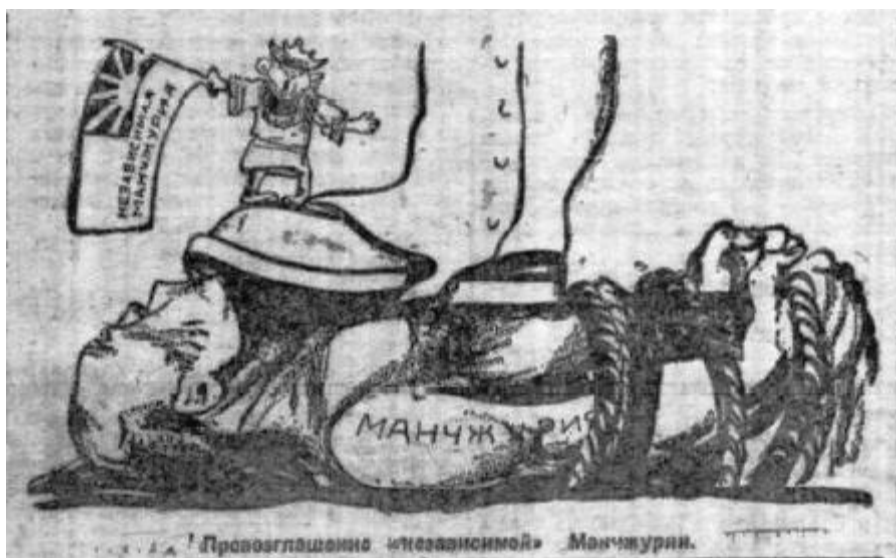
Илл. 10. «Провозглашение “независимости” Манчжурии»

Следующая интересная карикатура, формирующая у советского читателя образ Японии как державы-агрессора, которая поработила Манчжурию и использует образованное 1 марта 1932 г. независимое государство Маньчжоу-Го в своих целях, встречается нам в номере газеты «Советская Сибирь» за 21 марта 1932 г. с подписью «Провозглашение “независимости” Манчжурии». На карикатуре изображён лежащий на земле полуголый человек, олицетворяющий Китай. Человек связан тугой верёвкой и обездвижен, на горле и груди у него располагаются сапоги японского военного (илл. 10). А на сапоге изображён Пу И (император провозглашённого независимого государства Маньчжоу-Го), который держит в руке флаг. Что интересно, флаг делится на две части: на одной из них присутствует надпись «Независимая Манчжурия», а на другой изображён хиномару с шестнадцатью лучами, олицетворяющий флаг Японии. Таким образом, у читателя продолжает формироваться визуальный образ Японии как державы-агрессора, которая оккупировала территорию Манчжурии только с одной целью – использовать её для своих дальнейших военных планов и угнетения китайского народа.