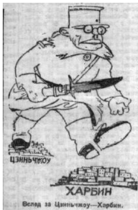
Илл. 6. «Захват Харбина на повестке дня у японской военщины»

В заметке газеты от 6 января 1932 г. под заголовком «Захват Харбина на повестке дня у японской военщины» представлена карикатура с подписью «Вслед за Цзиньчжоу – Харбин». На ней изображён возвышающийся над городами японский офицер со штыком в руках, который огромными ногами идёт от захваченного Цзиньчжоу в Харбин (илл. 6). В тексте статьи говорится о том, что японские войска активно продвигаются к границам внутреннего Китая. Сама же карикатура подталкивает читателя обратиться к дальнейшему тексту статьи,