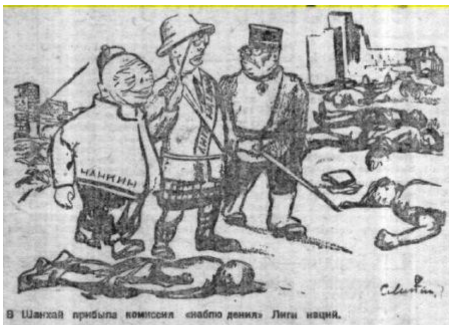
Илл. 9. «В Шанхай прибыла комиссия “наблюдения” Лиги наций»

Карикатура в номере газеты за 16 марта 1932 г. с подписью «В Шанхай прибыла комиссия “наблюдения” Лиги наций» сопровождает статью с заголовком «Вооруженный “мир” в Шанхае. Надежды на мирные переговоры проваливаются» 17 . На карикатуре читатель видит три фигуры: представителей Нанкина, Лиги Наций и Японии. Образ Японии на карикатуре выполнен в том же ключе, что и на остальных ранее рассмотренных нами карикатурах: японский офицер, со сведёнными бровями, укоризненно смотрит на делегата из Лиги Наций, тем самым выражая недовольство её вмешательством в разрешение японо-китайского конфликта (илл. 9).