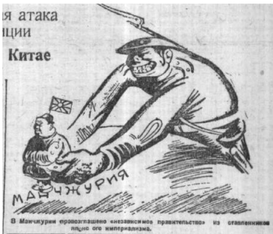
Илл. 8. «В Манчжурии провозглашено “независимое правительство” из ставленников японского империализма»

В публикации газеты за 27 февраля 1932 г. под заголовком «Новый японский десант в Шанхае. С часу на час ожидается генеральная атака интервентов на китайские позиции» 15 мы встречаем такую интересную карикатуру, сопровождающуюся подписью «В Манчжурии провозглашено “независимое правительство” из ставленников японского империализма» (илл. 8). На ней изображен улыбающийся японский солдат, простирающий свои руки над Манчжурией. На его раскрытых ладонях располагается представительный человек в китайском платье, который держит в руках японский флаг. Тем самым данная карикатура акцентирует две основных мысли: японские войска активно ведут боевые действия; правительство, которое формируется на территории Манчжурии, полностью подчиняется японскому. Подтверждение этому мы видим в самом тексте статьи под подзаголовками «Манифестации по случаю объявления “независимости”» и «Под руководством японских режиссёров». Газета пишет, что по всей Манчжурии проходят торжественные манифесты в честь объявления независимости и образования суверенного государства, а также в честь формирования нового правительства. Однако, по мнению редакции, данные события являются «комедией», умело срежиссированной японским правительством и его ставленниками, а «китайское население в манифестах участия не принимает» 16 .