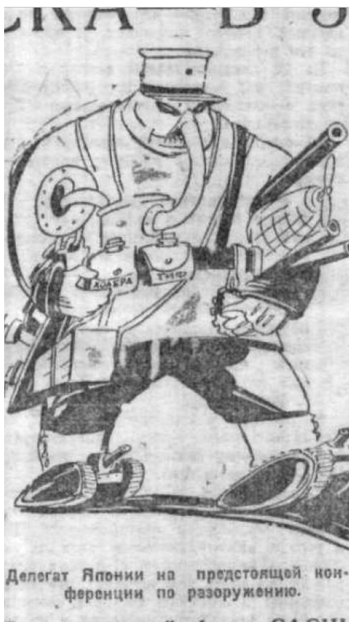
Илл. 4. «Делегат от Японии на предстоящей конференции по разоружению»