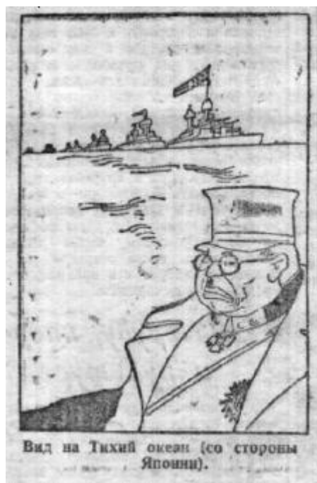
Илл. 5. «Вид на Тихий океан (со стороны Японии)»

Следующая карикатура, вышедшая в газете за 3 января 1932 г. с подписью «Вид на Тихий океан (со стороны Японии)» (илл. 5), также подтверждает мнение редакции о том, что в Тихоокеанском регионе начинаются полномасштабные военные действия между капиталистическими державами. На карикатуре Япония изображается японским офицером. Он недоволен тем, что «американский флот концентрируется “для маневров” на Тихом океане» 11 . В самом же тексте статьи подробно описывается реакция на активные действия Японии в Манчжурии другой страны, имеющей свои интересы в Китае, – Великобритании. Редакция приводит цитату из английской газеты «Пекин энд Тянь цзин Таймс», которая предостерегает Японию от военного захвата Цзиньчжоу (город, в который переместилось мукденское правительство после его захвата японскими войсками), высказывая предположение, что «осложнение манчжурского конфликта может повлечь за собой крупные международные последствия» 12 . Помимо этого, газета вновь поднимает вопрос о поддержке Японией белогвардейцев. В подзаголовке «Белогвардейские бандиты “рады стараться”» говорится о том, что белая эмиграция в Манчжурии полностью поддерживает японскую оккупацию и готова всесторонне поддержать её в дальнейшем.