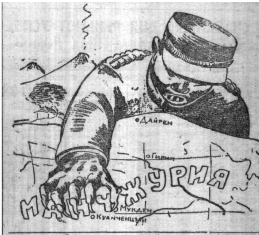
Илл. 1. «Японские милитаристы наложили свою лапу на Южную Манчжурию»

Обратим внимание на важную деталь. Гора Фудзи, один из основных символов Японского государства, изображена с выходящим из её жерла дымом. Эта деталь служит средством создания у советского читателя визуального образа Японии как государства, развязавшего военную конфронтацию в регионе. Она, как вулкан, может в будущем разверзнуться, и лава, несущая опасность, постепенно сможет накрыть не только Китай, но и территории других соседних государств, в том числе и Советский Союз.